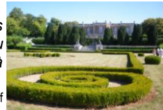
Le Château Neuf

Aujourd'hui, on peut louer le domaine pour des réceptions privées ou cocktails. Ce château propose également 5 chambres d'hôtes décorées à la mode du XV ème siècle.